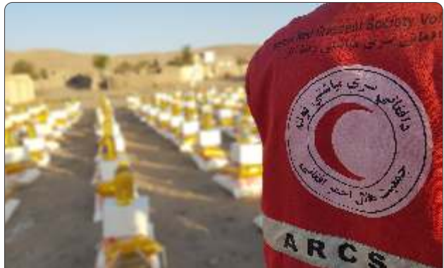
افغاني سره مياشت د رضاكاري پر محور ولاړه ده.