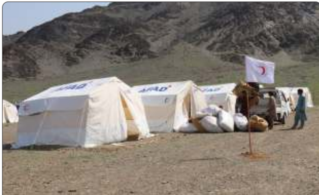
بشري ارزښتونه د افغاني سرې میاشتي له موخو څخه دي.