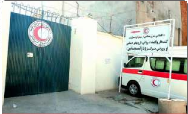
افغاني سره مياشت د انساني ژوند د ملاتړ او درناوي په موخه رامنځته شوي.