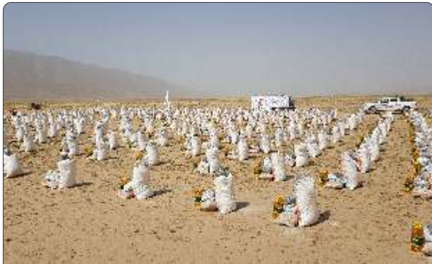
له افغاني سرې مياشتې ټولني د خيرپالو وگړو ملاتړ د بشريالو خدمتونو د پراختيا لامل گرځي.