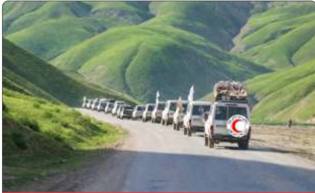
پېښځپلو ته د مرستې روسونې کاروان