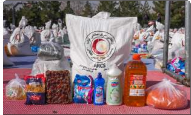
کډوالو ته د خوراکي او غیر خوراکي تو وپش