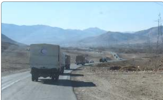
د افغاني سرې میاشتي نېبان د سولې، کډ ژوند او بشرپالنې سمبول دی.