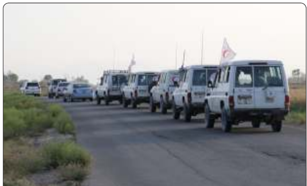
د بهرني مرستې روسونې کاروان