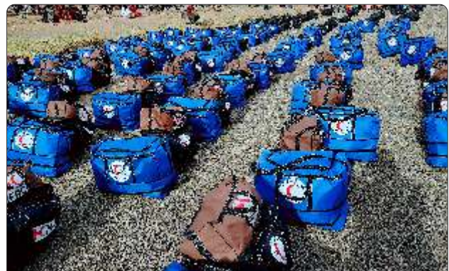
که چېرې ارمنو ته د مرستې رسونې هوډ لرئ، افغاني سره میاشت یې لاره ده.