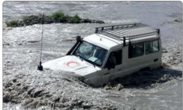
افغاني سره میاشت په بېرنيو حالاتو کې د پېښځپلو لاسنيوي ته وردانکي.