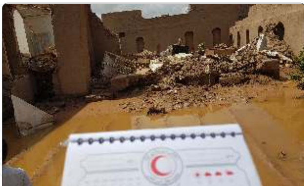
د طبيعي پېښو د زيانمن شويو د سروې جريان