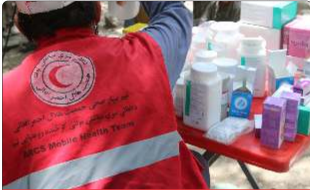
افغاني سره میاشت په بشرپالو خدمتونو کې خپلواکه ده.